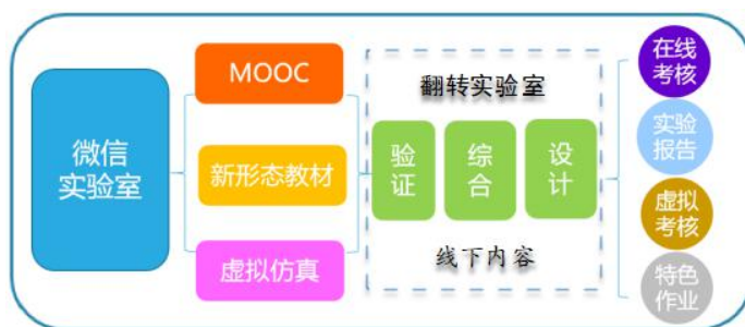
图 1 线上线下混合式实验教学构成

本课题的研究目标是形成“线上课程”、“虚拟仿真实验”和“线下实验”相融合的线上线下混合式教学新模式及科学合理的评价体系。具体说，是将资源融合为一体，构建一套完整的、操作性强的教学模式，并利用该模式科学、合理、高质量地实现实验教学、管理和评价的全过程。除此之外，探索信息技术对于实验教学的作用，总结其优势和不足也是课题开展的目的。项目建设的线上线下混合式教学的构成如图 1 所示。